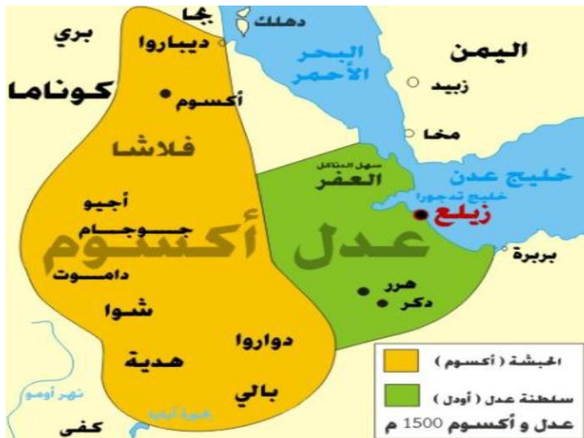
به نقل از کتاب نزهة المشتاق الیمن، ص ۴۶.