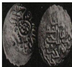
تصویر ۷: سکه رستم آق قویونلو، عبارت «علی ولی الله» روی سکه (نک. تراپی طباطبایی، «سکه‌های آق قویونلو»، ۱۱۶).