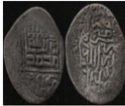
تصویر ۵: سکه اوزون حسن، عبارت «علی ولی الله» و نام خلفای راشدین روی سکه (نک. تراپی طباطبایی، «سکه‌های آق قویونلو»، ۵۰).