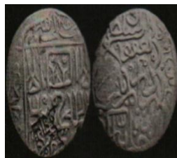
تصویر ۶: سکه یعقوب آق قویونلو، عبارت «علی ولی الله» روی سکه (نک. تراپی طباطبایی، «سکه‌های آق قویونلو»، ۷۵).