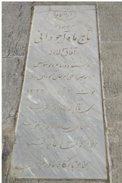
این تصویر توسط نگارنده در تاریخ ۱۴۰۱/۱۰/۱۴ از مزار تاج‌ماه آفاق‌الدوله در امامزاده عبدالله شهری برداشته شده‌است.