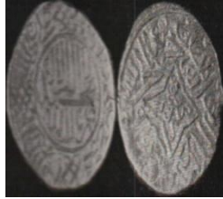
تصویر ۱: سکه جهان‌شاه قراقویونلو، ضرب فیروزکوه، عبارت «علی ولی‌الله» و نام خلفای راشدین روی سکه (نک. تراپی طباطبایی، «سکه‌های آق‌قویونلو»، ۱۸).