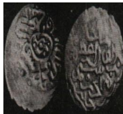
تصویر ۷: سکه رستم آق قویونلو، عبارت «علی ولی الله» روی سکه (نک. تراپی طباطبایی، «سکه‌های آق قویونلو»، ۱۱۶).