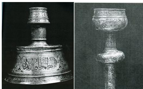
تصویر ۸: چراغ روغنی برنزی از دوران اوزون حسن آق قویونلو، حاوی کتیبه‌ای شامل اسامی دوازده امام علیهم‌السلام (نک. شایسته‌فر، ۱۲۶).