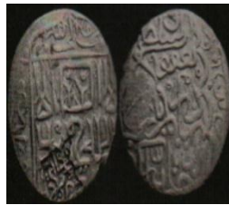
تصویر ۶: سکه یعقوب آق قویونلو، عبارت «علی ولی الله» روی سکه (نک. تراپی طباطبایی، «سکه‌های آق قویونلو»، ۷۵).