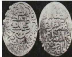
تصویر ۲: سکه حسن‌علی قراقویونلو، نام ائمه اطهار اثنی عشر علیهم‌السلام روی سکه (نک. تراپی طباطبایی، «سکه‌های آق‌قویونلو»، ۱۸).