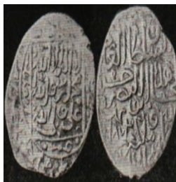
تصویر ۴: سکه اوزون‌حسن، عبارت «علی ولی‌الله» و نام ائمه اطهار علیهم‌السلام همراه نام خلفای راشدین روی سکه (نک. تراپی طباطبایی، «سکه‌های آق‌قویونلو»، ۴۸).