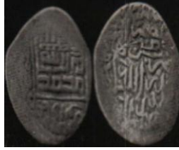
تصویر ۵: سکه اوزون حسن، عبارت «علی ولی الله» و نام خلفای راشدین روی سکه (نک. تراپی طباطبایی، «سکه‌های آق قویونلو»، ۵۰).