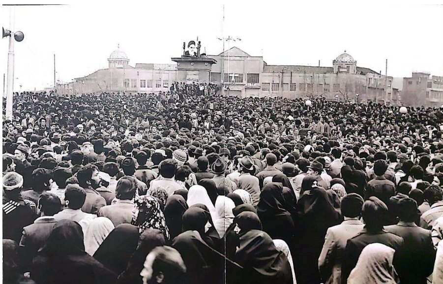
تظاهرات انقلابی مردم در همدان، زمستان ۱۳۵۷ شمسی (استعدادی، ۱۳۹۳، ص. ۲۰۶-۲۰۷)

در تاریخ ۱۵ خرداد سال ۱۳۴۲ نیز تحصن گسترده‌ای در بازار و شهر توسط کسبه بازار شکل گرفت و سال‌های ۱۳۵۶ و ۱۳۵۷ ش که اوج دوران شکل‌گیری انقلاب اسلامی بود، تظاهرات، تحصن‌ها، تعطیلی‌ها، پخش اعلامیه‌ها، شعار گویی و شعارنویسی‌های گسترده‌ای در بازار و توسط بازاری‌ها اتفاق افتاد (بازاریان همدان، ۱۴۰۱ ش).