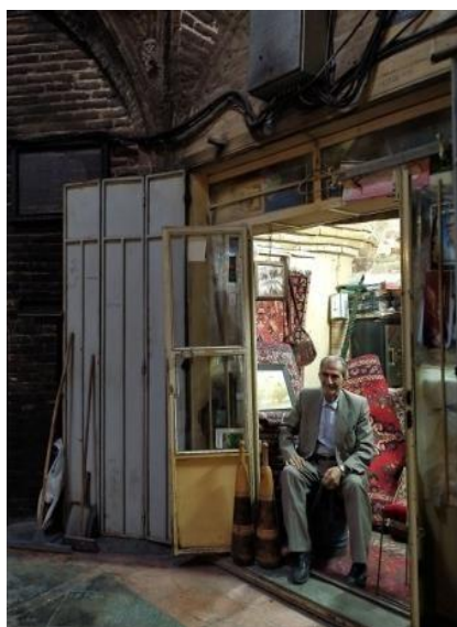
تصویر: یکی از کسبه در هشتی سمسارخانه (آرشیو نگارندگان)