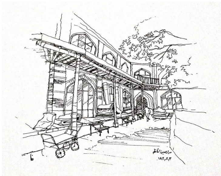
تصویر: کروکی سرای میرزا کاظم (ترسیم نگارندگان)