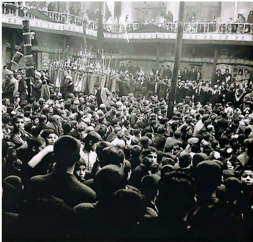
روضه‌خوانی روز تاسوعا، سرای شریفیه، دهه ۱۳۴۰ شمسی (استعدادی، ۱۳۹۳، ص. ۲۰۵)

در همدان تا حدود سال ۱۳۶۰ش بازار اصلی‌ترین کانون برپایی عزاداری ماه‌های محرم و صفر بوده‌است. پس از آن با متفرق شدن اصناف و تغییر آداب و رسوم بازار این مراسم‌ها بسیار مختصر شده و به مساجد کشیده شده‌است. در بازار، مسجد پیغمبر کانون برگزاری مراسم محرم و صفر بود و هر یک از اصناف بازار به مدت ده روز در این مسجد متصدی برپایی مراسم هستند و شرکت‌کنندگان نیز عموماً کسبه بازار هستند (بازاریان همدان، ۱۴۰۱ش).