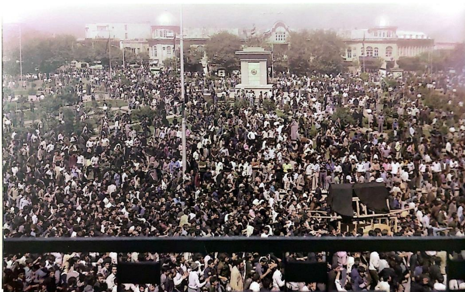
تشییع جنازه آیت‌الله آخوند ملاعلی معصومی همدانی، شهریور ۱۳۵۷ (استعدادی، ۱۳۹۳، ص. ۲۰۹)