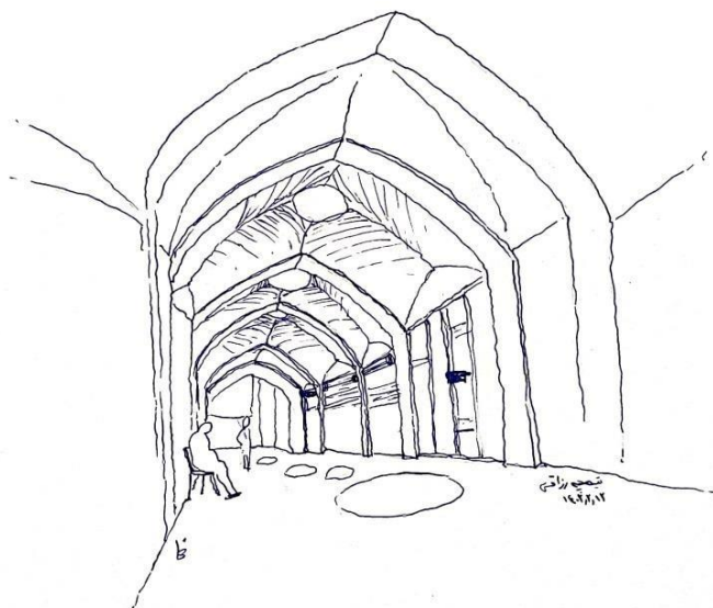
تصویر کروکی تیمچه رزاقی (ترسیم نگارندگان)