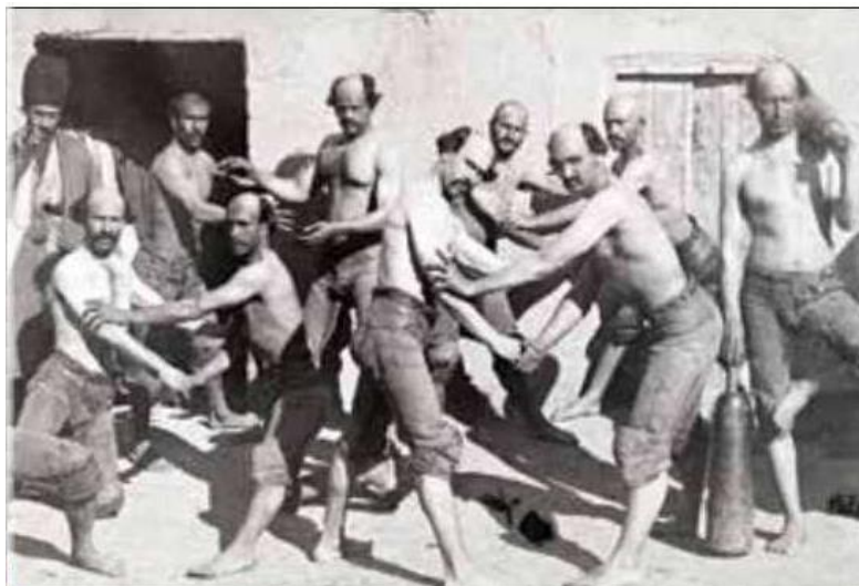
تصویر: عکس جمعی از پهلوانان همدان (سرلکی، ۱۳۹۵، ص. ۱۵)

استفاده می‌شدند. بسیاری از کسبه، مانند آنان در راسته سمسارخانه، صبح‌ها پیش از شروع کار در دکان‌های خود به ورزش باستانی می‌پرداختند. علاوه بر این، از فضاهای وسیعی مانند حیاط کاروانسرای میرزا کاظم برای ورزش‌ها و بازی‌های تفریحی دیگر مانند گل‌کوچک، والیبال، وزنه‌برداری، مچ‌اندازی و کشتی نیز استفاده می‌شده‌است.