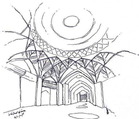
تصویر: کروکی هشتی سمسار خانه (ترسیم نگارندگان)

در بازار سنتی همدان، پذیرایی و اطعام مهمانان کارکرد فرهنگی بود که در قالب‌های گوناگونی نمود داشت. قهوه‌خانه‌های بزرگ واقع در راسته‌های اصلی یا حیاط کاروانسراها، محل اصلی پذیرایی مردان بودند و غذاهای محدودی طبخ می‌شد. حضور زنان در این مکان‌ها عرف نبود، مگر در مناسبت‌های خاص مانند پذیرایی خانواده‌های عروس و داماد پس از خریدهای عروسی. همچنین، پخش نذورات در مناسبت‌های مختلف، مانند نذر شب‌های جمعه حاج‌آقا سبزواری در هشتی سمسارخانه با تزئینات خاص و پذیرایی با شربت گلاب و اسپند، بخشی از فرهنگ اطعام عمومی در بازار را تشکیل می‌داد (بازاریان همدان، ۱۴۰۱ش).