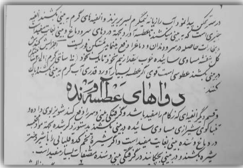
تصویر ۷: نسخه پزشکی به خط مرحوم دکتر سید احمدعلی خسروی (خسروی، ۱۳۵۲، ص. ۹)