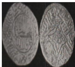
تصویر ۱: سکه جهان‌شاه قراقویونلو، ضرب فیروزکوه، عبارت «علی ولی‌الله» و نام خلفای راشدین روی سکه (نک. تراپی طباطبایی، «سکه‌های آق‌قویونلو»، ۱۸).