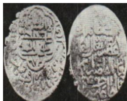
تصویر ۲: سکه حسن‌علی قراقویونلو، نام ائمه اطهار اثنی‌عشر علیهم‌السلام روی سکه (نک. تراپی طباطبایی، «سکه‌های آق‌قویونلو»، ۱۸).