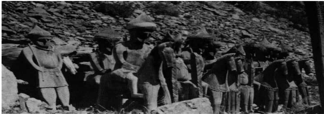
تمثال‌های گروهی با ظاهری متفاوت در نزدیک یک مقبره؛ عمامه دور سر، عده‌ای ایستاده و عده‌ای سوار بر اسب که نشان‌دهنده وضع اقتصادی و جایگاه افراد است (Wlodek, 36).

مردم نورستان خانه‌های خود را با استفاده از چوب می‌ساختند، زیرا سرزمین نورستان پوشیده از جنگل و درختان سرو بود. حرفه نجاری، ساخت خانه، پنجره، دروازه، سقف و دیگر وسایل مورد نیاز برای ساخت خانه از جمله کارهای بردگان بود. نورستانی‌ها سقف خانه خود را توسط تخته‌های چوبی نازک می‌پوشانیدند. ستون‌های چوبی که در داخل خانه و در وسط اتاق‌ها برای استوار نگهداشتن سقف نصب می‌شدند نیز از چوب درست می‌شد. این ستون‌ها بخش مهم تزئین خانه‌های مردم بود. بیشتر مردم ستون‌های خانه خود را با کنده‌کاری و حکاکی تزئین می‌کردند. کنده‌کاری نیز از مهارت‌های بردگان بود (رابرتسون، ۵۴۶).